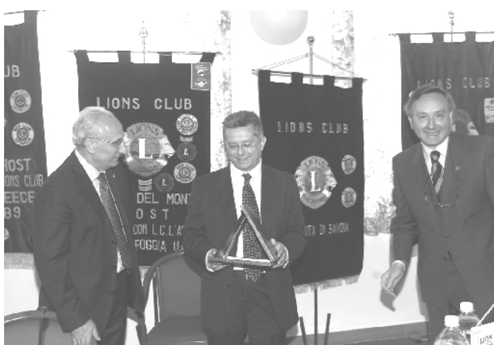
SERVIZIO FOTOGRAFICO DELLO STUDIO CALVARESI